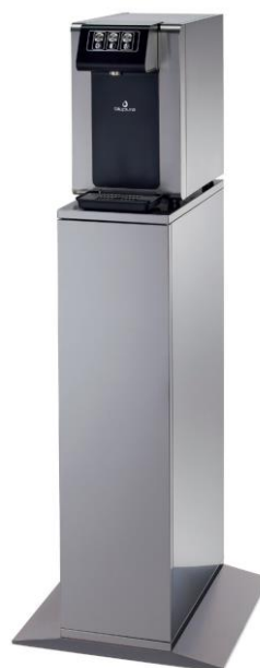
Blusoda + option Cabinet G

Support réalisé entièrement en acier inoxydable pour une plus grande stabilité